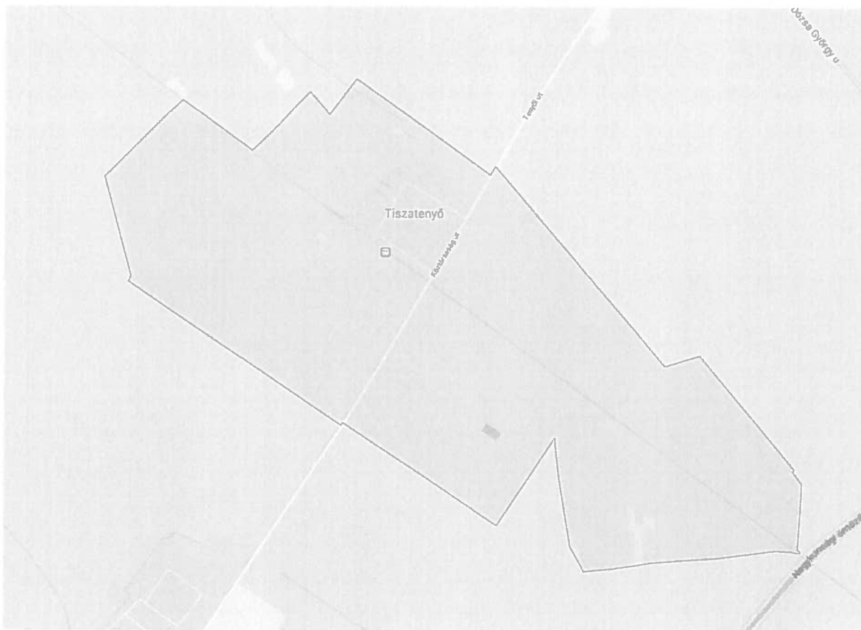
(Térkép a helyi egyedi építészeti védelem alatt álló létesítmények feltüntetésével)